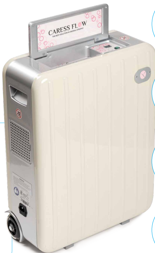
Roztok Caress Flow